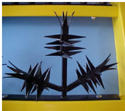
MÓDULO PROTECTOR ZARZAL

Mod. ZARZAL Para bardas desde 1.80 m. de altura