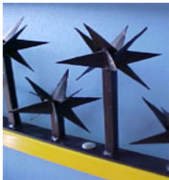
MÓDULO PROTECTOR OCOZAL ESPECIAL

Mod. OCOZAL ESPECIAL Para bardas desde 1.80 m. de altura