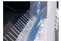
ACACIA ® MÓDULO PROTECTOR ACACIA®