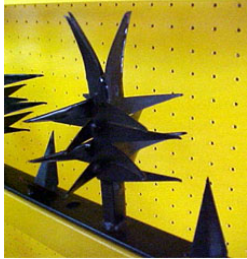
MÓDULO PROTECTOR CACTUS

Mod. CACTUS ® Para bardas desde 1.80 m. de altura