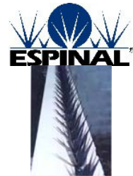
MÓDULO PROTECTOR ESPINAL®

Mod. ESPINAL ® Para bardas desde 2.0 m. de altura